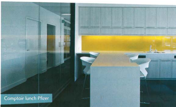
Comptoir lunch Pfizer

pour le travail et la rencontre. Pour le repos, nous avons conçu une cafétéria incluant différents types d'ergonomie tels des comptoirs-lunch, des coins banquettes et des espaces lounge plus feutrés. L'important était d'offrir une variété d'espaces pour différentes façons de travailler et de se reposer, et de bien communiquer aux employés le niveau de bruit permis dans chaque zone. »