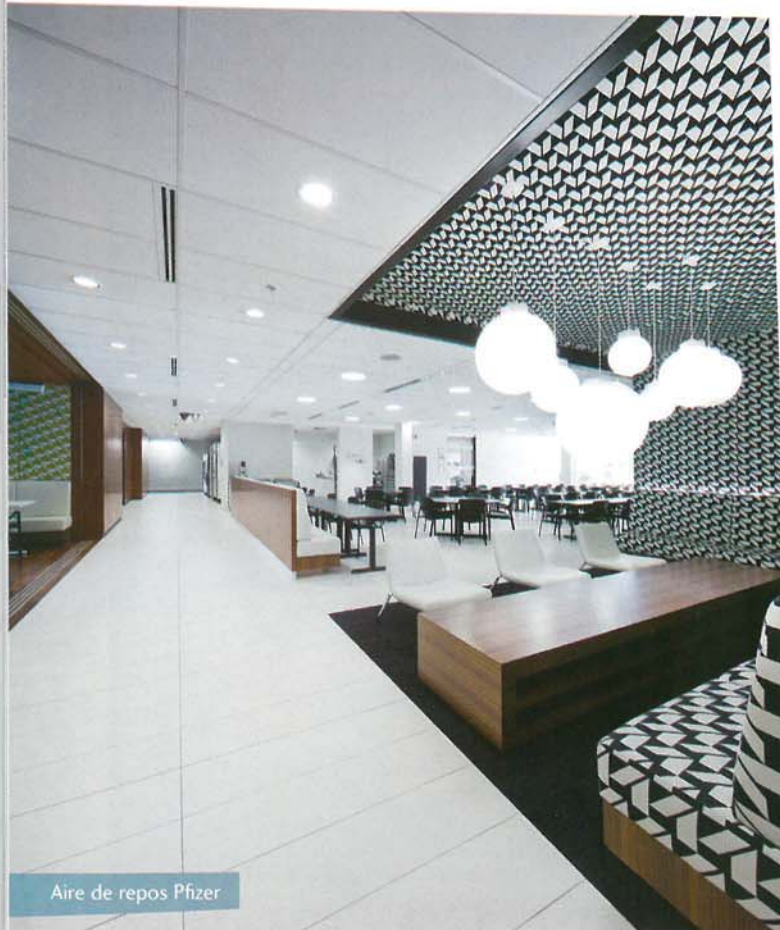
Aire de repos Pfizer

À ceux qui souhaiteraient transformer leurs lieux de travail pour les rendre plus innovants, M. Bourassa ajoute comme conseil de tenir compte du confort thermique et de l'acoustique. «En ce moment, la tendance est aux aires ouvertes et aux plafonds ouverts, avec des gaines de ventilation apparentes, commente-t-il. Ce sont des surfaces réfléchissantes qui peuvent rendre les lieux très bruyants. Les cloisons et les plafonds acoustiques peuvent servir à amortir le bruit. La moquette peut être une autre option, mais, selon moi, il s'agit d'une erreur puisqu'elle diminue la qualité de l'air en accumulant les agents allergènes. Il vaut mieux avoir des planchers lisses et lavables. En gros, on peut être innovateur, mais il faut rechercher un bon équilibre entre le confort et l'efficacité.» ■